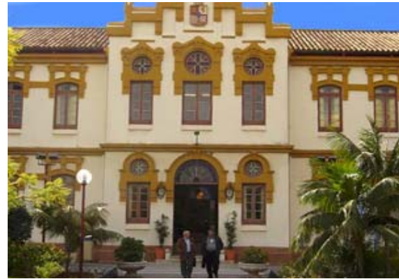
Centro Cívico de la Diputación Provincial de Málaga Avenida de los Guindos, 48, 29004-Málaga